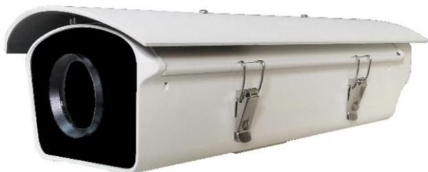
モデル名 < CC112GELLP >